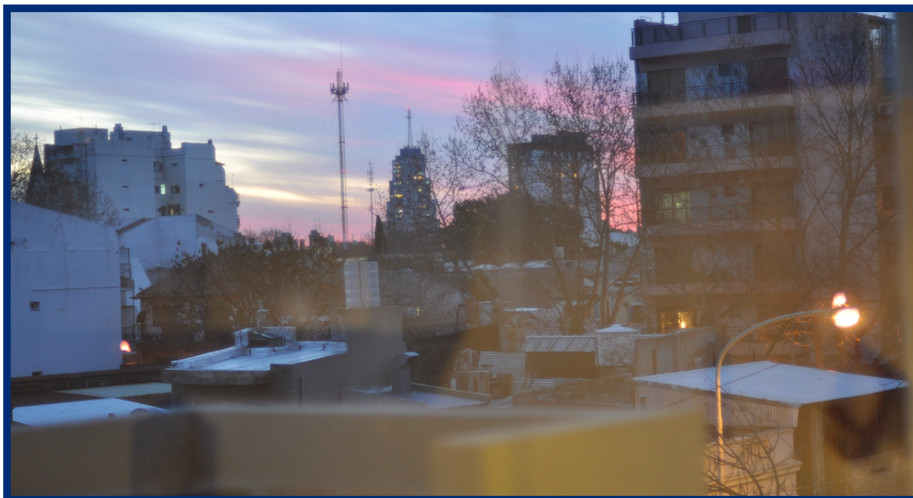
Atardecer en el barrio hace algunos años.